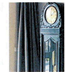
Noch ist Zeit, im Wohnzimmer...