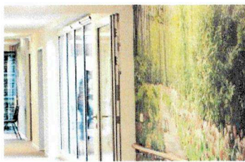
...und auf den Fluren.