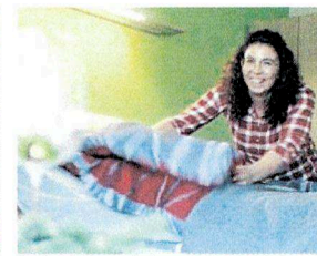
Im Petri Haus wird gern und oft gelacht.